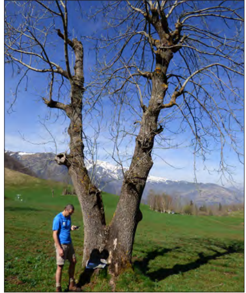
Figure 3. – Frêne dans lequel a été capturé S. (S.) erythroptera à Villelongue en juin-juillet 2014 (Hautes-Pyrénées).