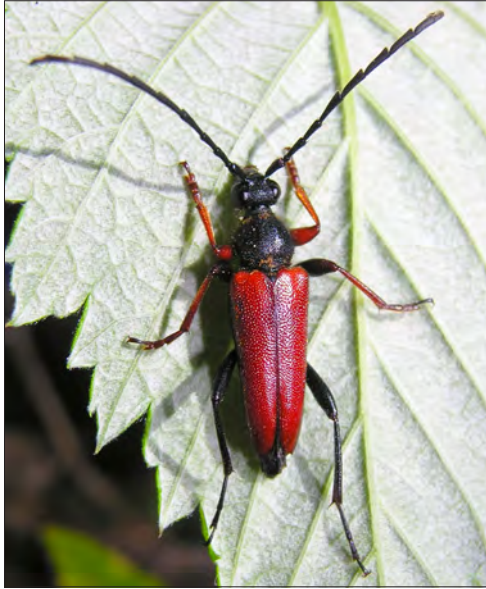
Figure 2. – Stictoleptura (S.) erythroptera à Bruère-Allichamps (Cher) en juin 2012.