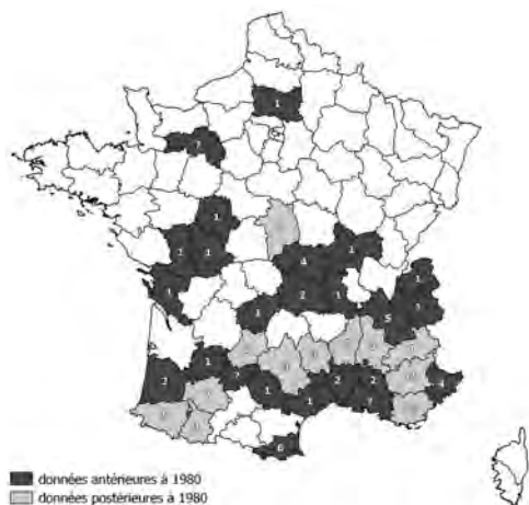
Carte 1. – Répartition avant et après 1980 et nombre de localités connues par département.

Le piégeage qui s'est beaucoup développé en France ces trente dernières années, a permis de révéler ou de confirmer sa présence dans de nombreux départements. Les données bibliographiques, pour bon nombre d'entre elles, sont très anciennes et font souvent référence à une seule capture connue. Nous proposons de faire ici, la synthèse des captures et observations inédites postérieures à 1980.